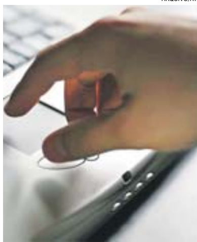
CUIDADO ao digitar as senhas

Fonte: Especialistas em Segurança Pública.