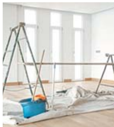
OBRA em apartamento: queixa

> QUANDO não há marcação fixa de vagas de garagem, moradores reclamam que veículos grandes, como pi-